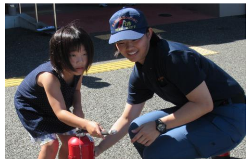
谷山区長賞 「私も消火器訓練」