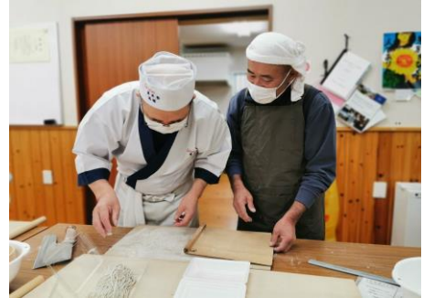
米多比区長賞 「うま～く出来ているぞ～！」