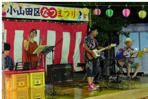
小山田区長賞 「熱唱！小山田ブルース」