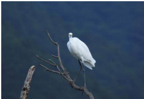
薦野区長賞 「カッコよく立ちたい ～チュウサギ」