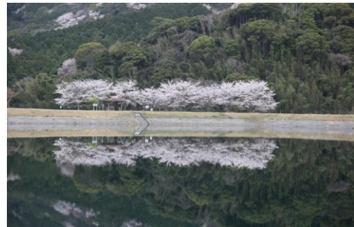
薬王寺区長賞 「水鏡」