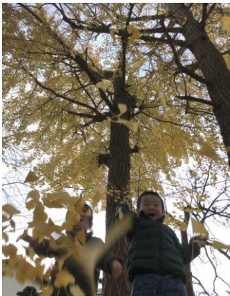
薦野区長賞 「天降神社の銀杏」