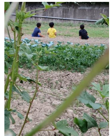
谷山区長賞 「オクラの成長」