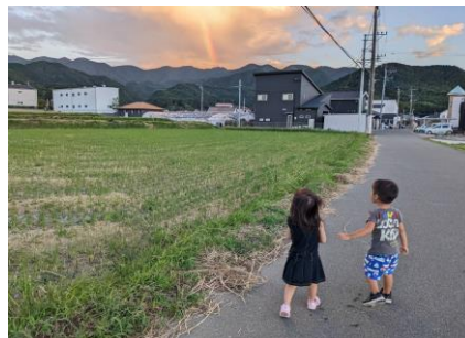
米多比区長賞 「虹だ！」