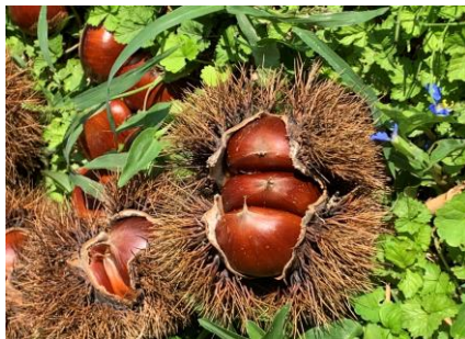
小山田区長賞 「クリっ子3兄弟」