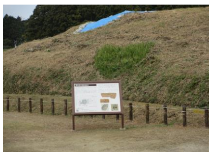
谷山区長賞 「船原古墳でハート」