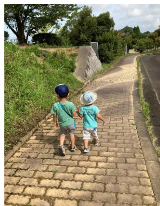
薦野区長賞 「夏のおさんぽ」