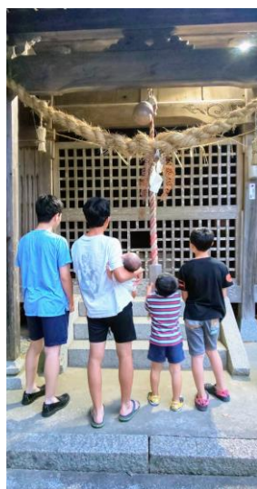
薬王寺区長賞 「お宮参りin白髭神社」