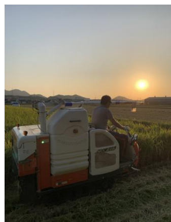
小山田区長賞 「夕陽を追いかけて」