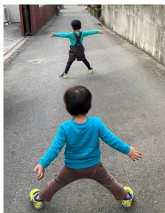
米多比区長賞 「ちいさい大人」