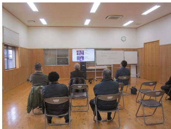
大形テレビジョンによる 薦野公民館での移動展示

12月には作品集を作成して関係各所に配布。また、「野幸山幸おのまつり」会場での入賞作品展示ができなかったため、令和2年度に購入した大型テレビジョンを活用して各公民館で移動展示を行った。