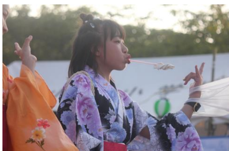
米多比区長賞 「夏まつり」