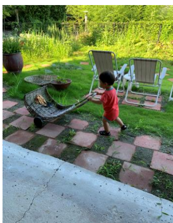
薦野区長賞「さあひとしごと!!」