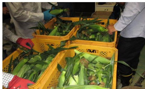
谷山区長賞「スイートコーンの収穫」