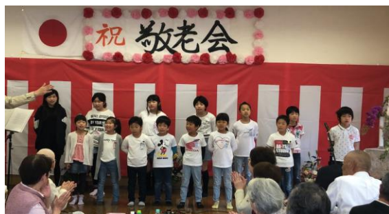
小山田区長賞「敬老会 歌のプレゼント」