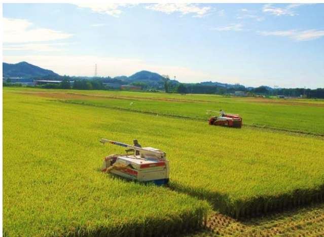
風景部門 グランプリ 「秋晴れと実り」