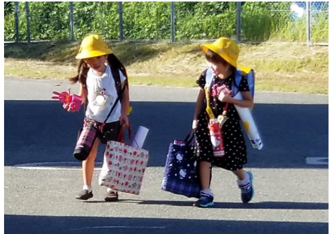
人物部門 グランプリ 「夏休み、 しゅくだいいっぱい 思い出いっぱい」